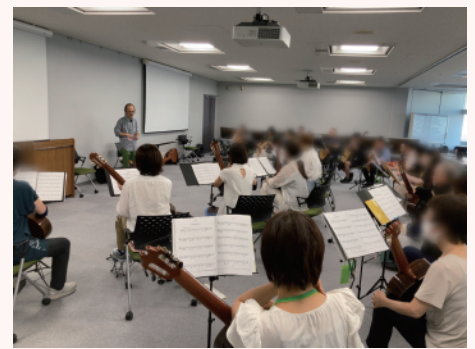
高校生から70代まで、クラシックギター仲間の輪が広がります!