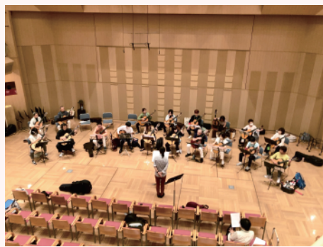
本番会場のコンサートホールで練習できます!