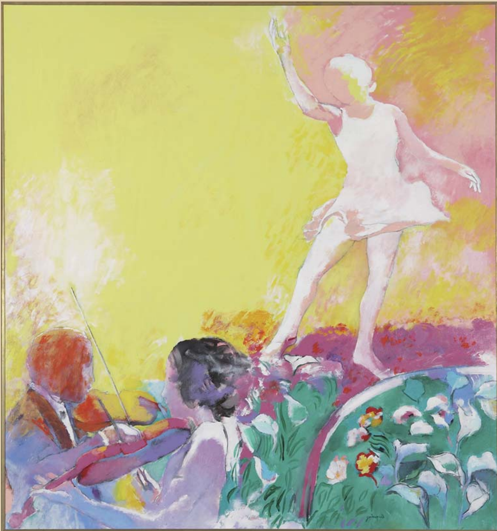
ホール3Fホワイエ壁面 ポール・ゴアマン作「ダンサー」